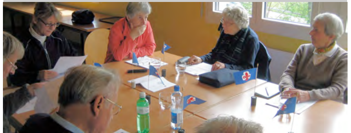
Schweizerische EPS-Generalversammlung am 12. Juni in Biel Besammlung zum sehr interessanten und eindrücklichen Stadtrundgang