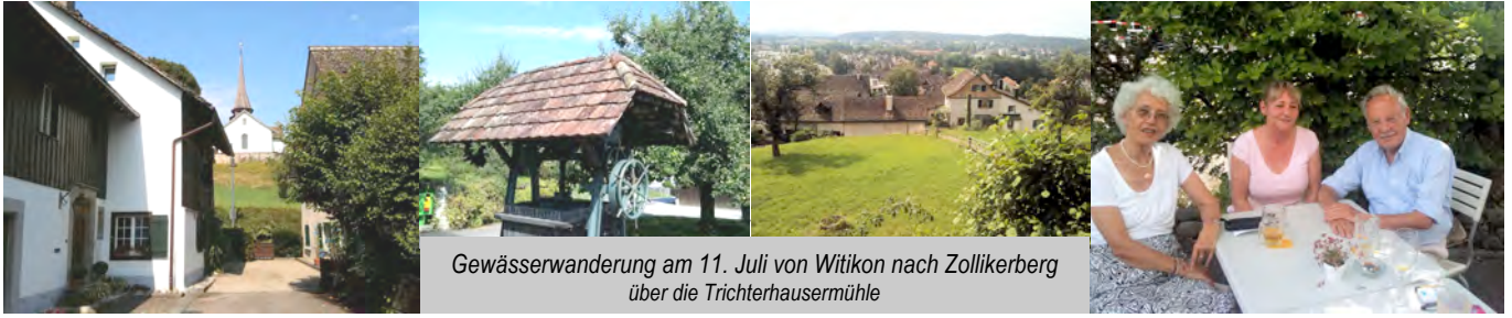
Gewässerwanderung am 11. Juli von Witikon nach Zollikerberg über die Trichterhausermühle