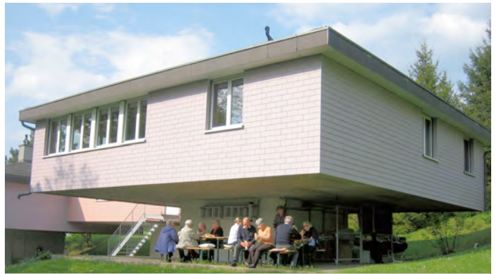
Generalversammlung unserer Sektion am 8. Mai im Pfadiheim Kilchberg