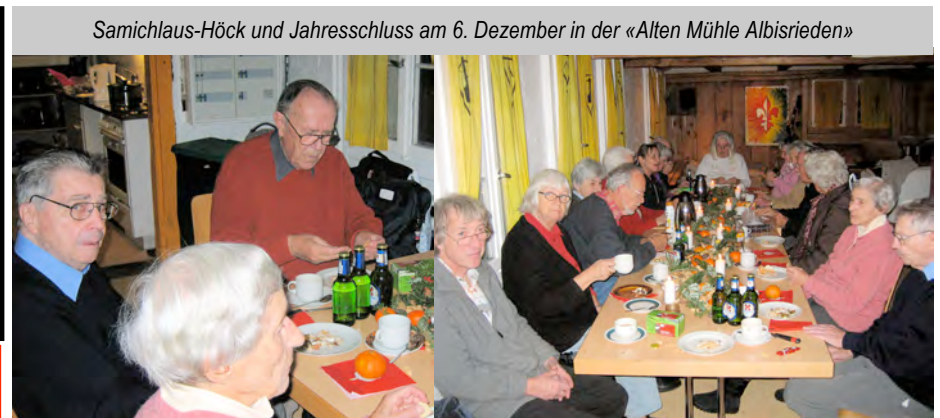
Samichlaus-Höck und Jahresschluss am 6. Dezember in der «Alten Mühle Albisrieden»

www.eps-asds.ch orientiert über Alles im EPS und in unserer Sektion