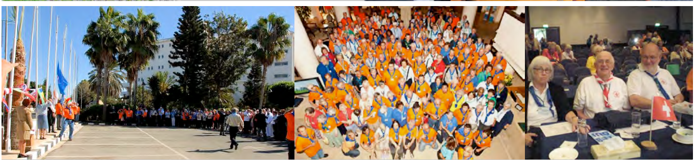
7. Europakonferenz in Zypern vom 4. bis 6. Nov. mit Konferenzreise bis 11. November. Auch einige Mitglieder unserer Sektion nahmen daran teil.