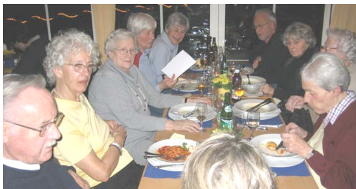
Uetlibergbummel am Di, 15. Jan. 2008 zum Treffpunkt Gmüetliberg