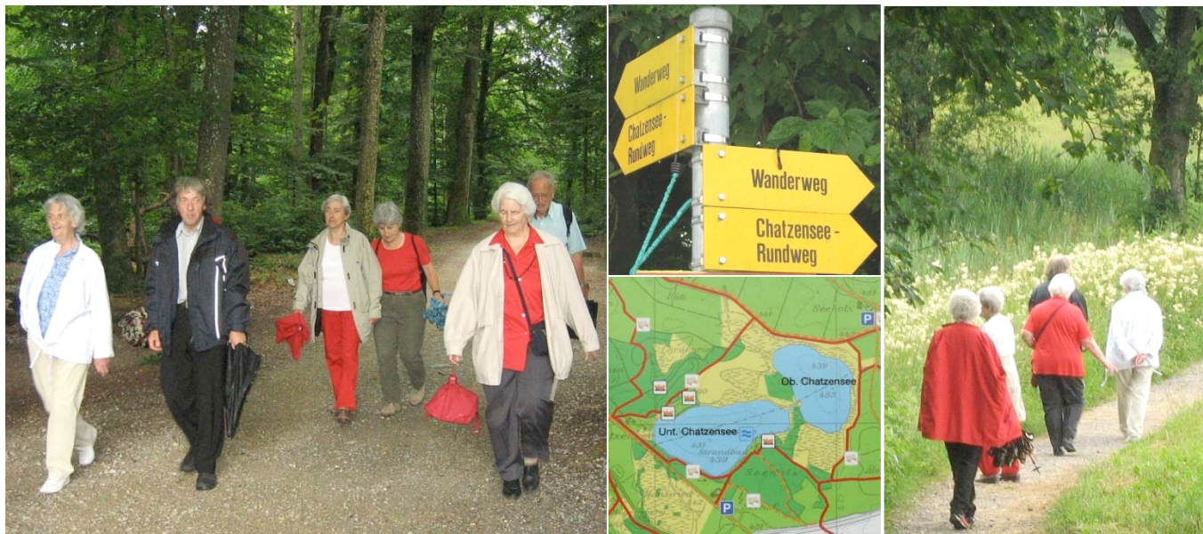
Gewässerwanderung rund um die beiden Chatzenseen bei Zürich-Affoltern am Sonntag, 6. Juli 2008