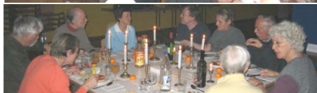
Chlauhock (Jahresschluss) in der «Alten Mühle Albisrieden» am Montag, 1. Dezember 2008